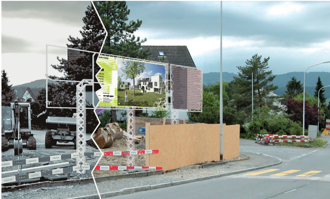
Hier wird alles massgeschneidert.

Wenn für einzigartige Projekte eine aussergewöhnliche Ankündigung verlangt wird, sind Sie bei uns an der richtigen Adresse.